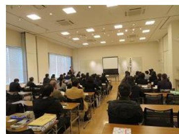
郡三師会と養護教諭との交流会の様子

ただし、通常の腎性糖尿以外にも、尿細管の以上による血糖正常・尿糖陽性をきたす疾患は存在し、その場合重篤な病気の可能性もありますので、注意は必要です。いずれにしても、尿糖陽性であれば、血糖検査は必須です。